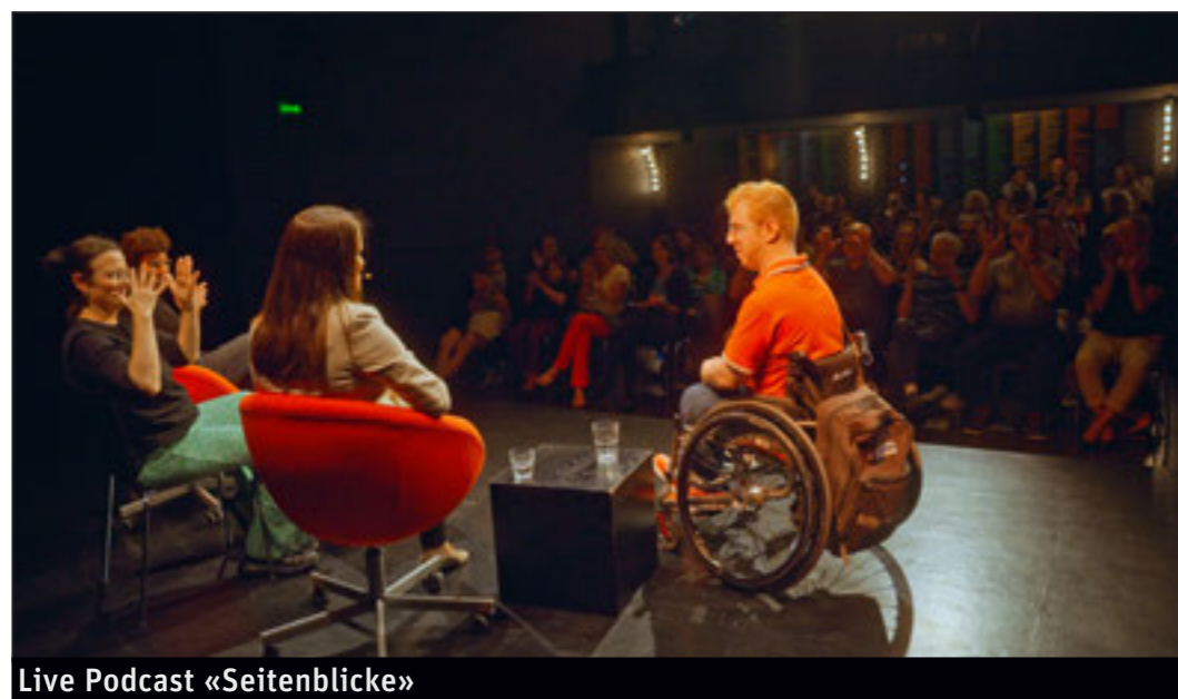
Live Podcast «Seitenblicke»

Damit künftig mehr Menschen mit Behinderungen selbstverständlicher Teil unseres Publikums darstellen, konnten weitere Hürden abgebaut werden: Im Ticketsystem wurde die Anzahl der buchbaren Rollstuhlplätze erhöht und neu können Rollstuhlplätze, wie auch die Plätze für Assistenzpersonen, ohne den Weg über das Theaterbüro selbständig gebucht werden. Eine Holzrampe am Haupteingang ermöglicht eine bessere Zugänglichkeit ins Theater und Treppenmarkierungen verleihen der ersten und letzten Treppenstufe bessere Sichtbarkeit.